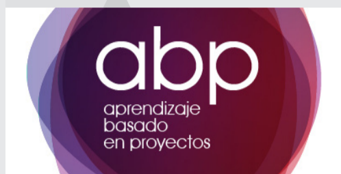
Aprendizaje basado en proyectos (ABP)

Destinados a docentes y a opositores docentes. Se realizan a través de la Fundación Universidad Empresa de Cádiz (Fueca)