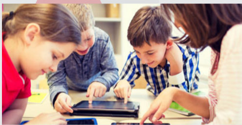
Metodologías Activas e Innovadoras en el Aula. El Aprendizaje Cooperativo