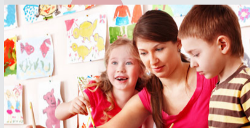
Currículum y Programación Didáctica