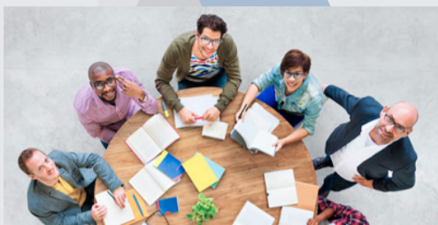
Atención a la Diversidad del Currículum en Educación Primaria