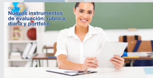
Nuevos instrumentos de evaluación: rúbrica, diana y portfolio