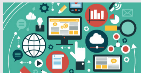
Webquests, blog, redes sociales en el aula