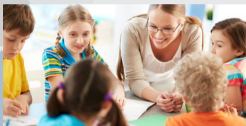
Relaciones Interpersonales y Modificación de Conducta en el Aula