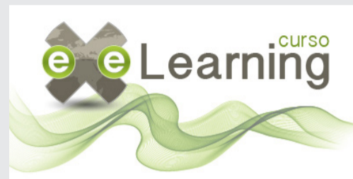
Conocimiento básico en el uso de la herramienta exeLearning