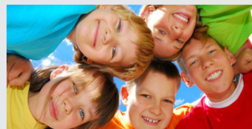
Las Dificultades de Aprendizaje en Secundaria. Estrategias y Programas