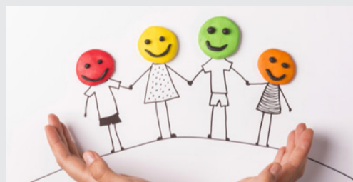
Prevención y resolución de conflictos en los centros docentes