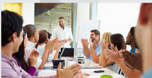
Formador de Formadores de F.P. Reglada y Formación Continua