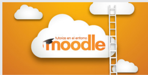
La tutoría virtual en el entorno Moodle