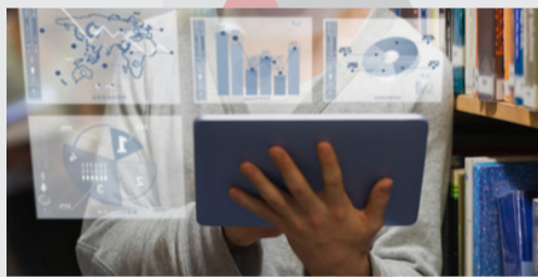
Nuevas tecnologías y educación. Aplicaciones para trabajar e innovar en el aula